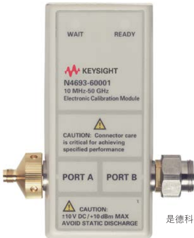
是德科技提供各種不同的電子校正模組

每 12 個月定期校驗電子校正 (Ecal) 模組， 可確保最準確的向量網路分析儀 (VNA) 量測