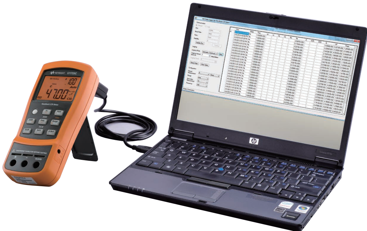
図1. U1731C/U1732C/U1733CをPCに接続すれば、連続した読み値の自動記録が可能

ハンドヘルドLCRメータを使用すれば、損失係数(D)、Q値(Q)、インピーダンスの角度表示( \theta )のセカンダリディスプレイ表示を含め、さまざまなコンポーネント・タイプをテストできます。この新しいハンドヘルドシリーズは、この他にも、より詳細なコンポーネント解析機能を備えています。例えば、内蔵の等価直列抵抗(ESR)機能を使用すれば、選択した周波数におけるコンデンサの固有抵抗特性をより良く理解できます。DCRは内蔵DC抵抗測定であり、コンポーネントテストに個別のデジタルマルチメータ(DMM)は必要はありません。