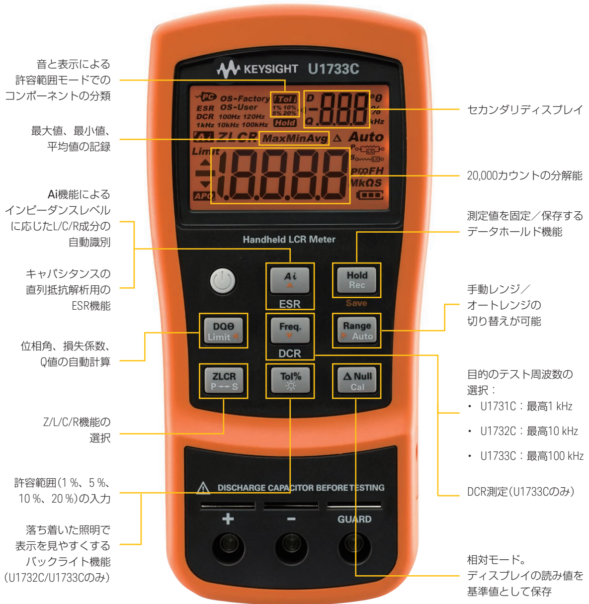
図2. U1733Cのフロントパネル