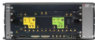
ビット・エラー・レシオ・テスト・ソリューション BERT