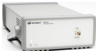
偏波ソリューション