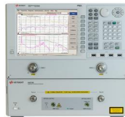
光コンポーネント・アナライザ