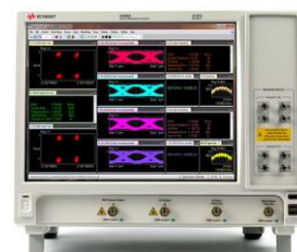
光変調アナライザ