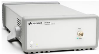
偏波ソリューション