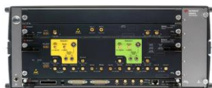
ビット・エラー・レシオ・テスト・ソリューション BERT